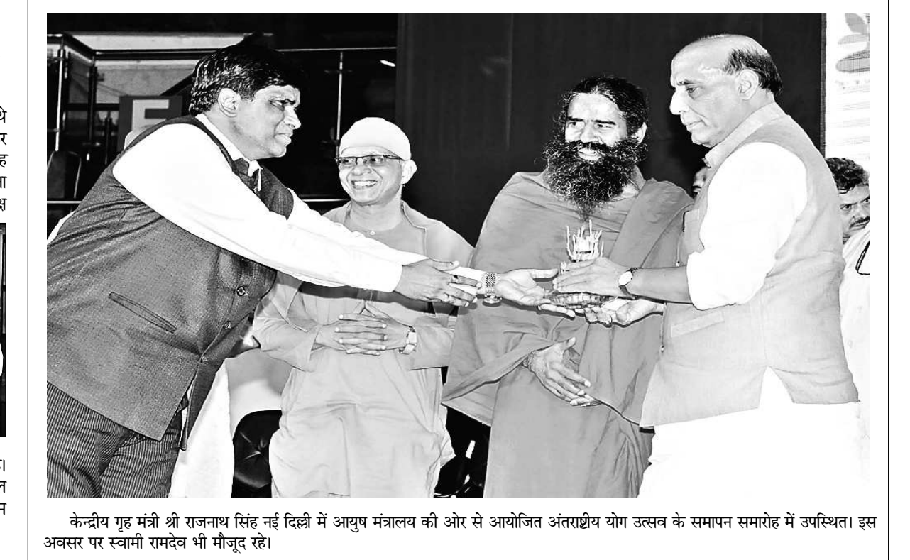
केन्द्रीय गृह मंत्री श्री राजनाथ सिंह नई दिल्ली में आयुष मंत्रालय की ओर से आयोजित अंतराष्ट्रीय योग उत्सव के समापन समारोह में उपस्थित। इस अवसर पर स्वामी रामदेव भी मौजूद रहे।

बराक ओबामा भारत दौर पर आए थे तब उन्हें पीएम मोदी ने बराक कहकर पुकारा था। विपक्षी दुर्लों ने यह कहकर पीएम मोदी की आलोचना की थी कि किसी देश के राष्ट्रध्यक्ष